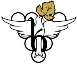
მელნიერობა ხარება WINERY KHAREBA

ca. 4 Stunden nach Kutaisi, Ankunft in der Nacht. anschl. direkter Zimmerbezug in ihrem Hotel in Kutaisi. Am Vormittag Besichtigung der Khareba Kellerei in Terjola mit anschl. Weinprobe und Mittagessen. Am Nachmittag Transfer nach Tiflis ca. 3 1/2 Std. Abendessen im Restaurant Funicular mit traumhafter Sicht auf die Stadt und Übernachtung im Hotel in Tiflis